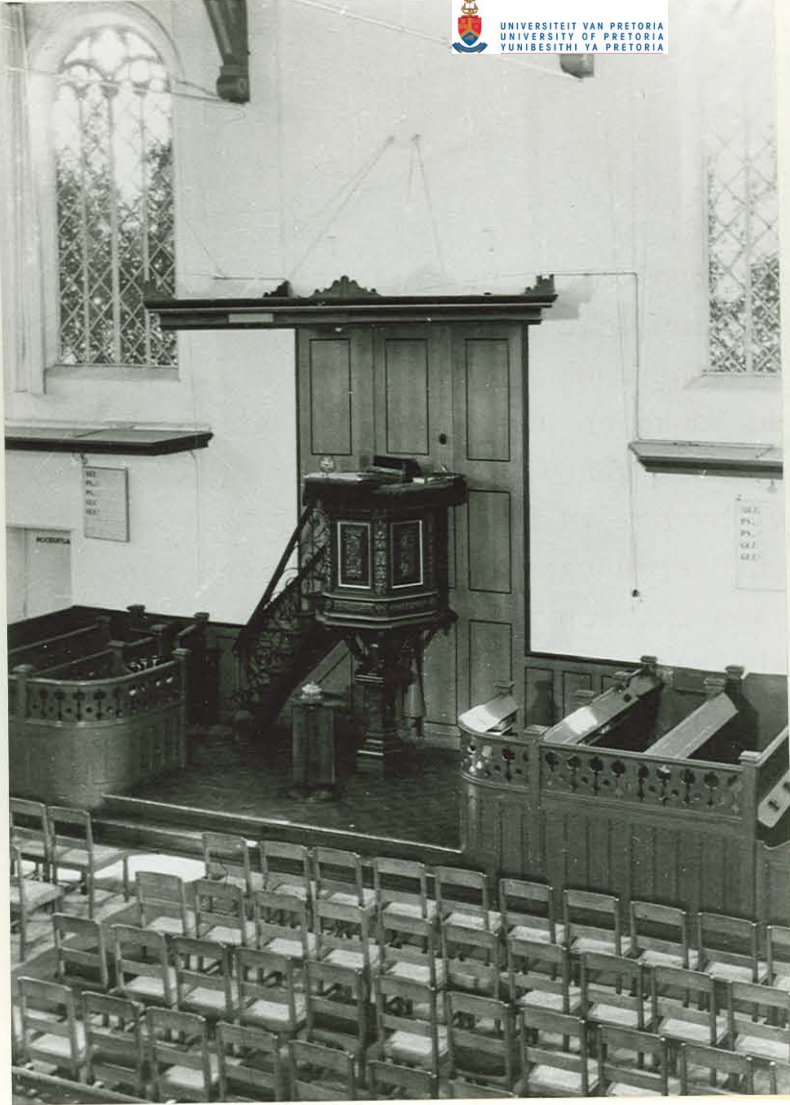
De Gereformeerde Kerk. BAARN.